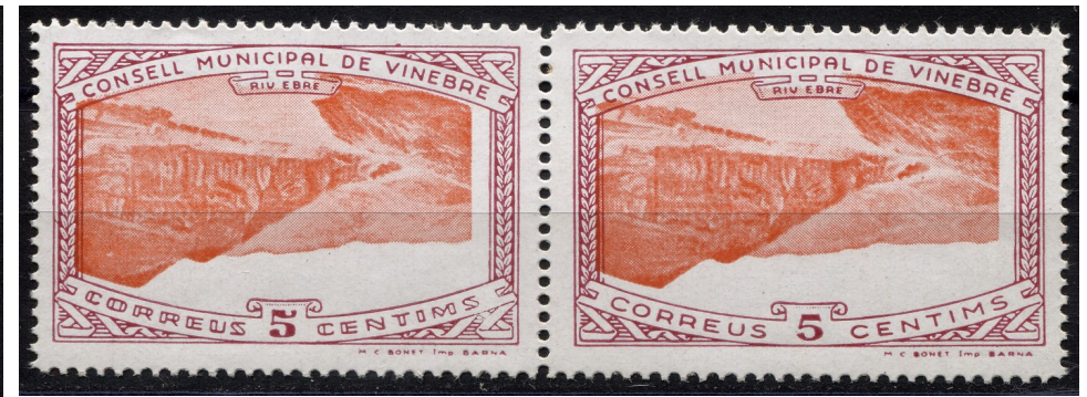
16 (Allepuz no cat) Parella horitzontal