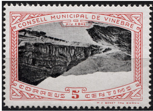
9 (Allepuz 3a) Caracters dobles