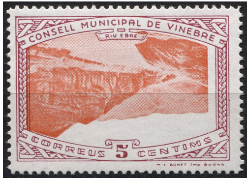
13 (Allepuz 4a) Caracters dobles