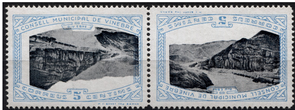
3 (Allepuz 1aii) Parella capicua