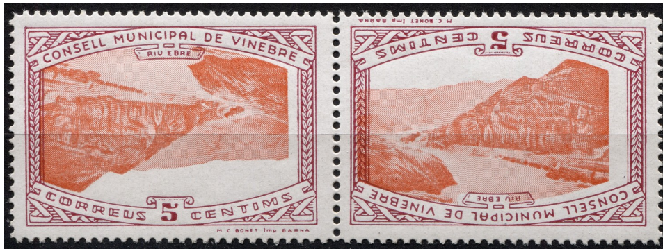
15 (Allepuz no cat) Pareja capicua