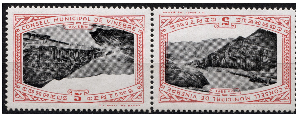
Error de centre invertit, parella capicua