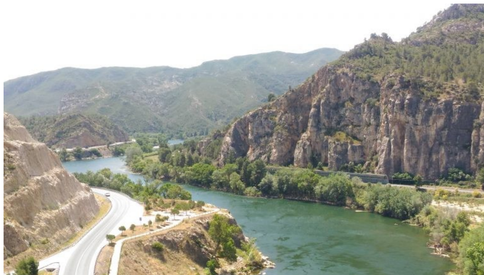
Vista actual del Pas de l'Ase