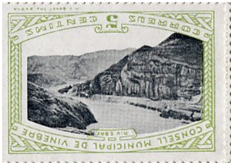
Vista del Pas de l'Ase utilitzada al disseny dels segells

Aquesta emissió també és un dels pocs exemples de segells il·lustrats amb una fotografia. Al segell hi figura la inscripció "Riu Ebre", i la foto mostra el riu a través de l'estret del Pas de l'Ase.