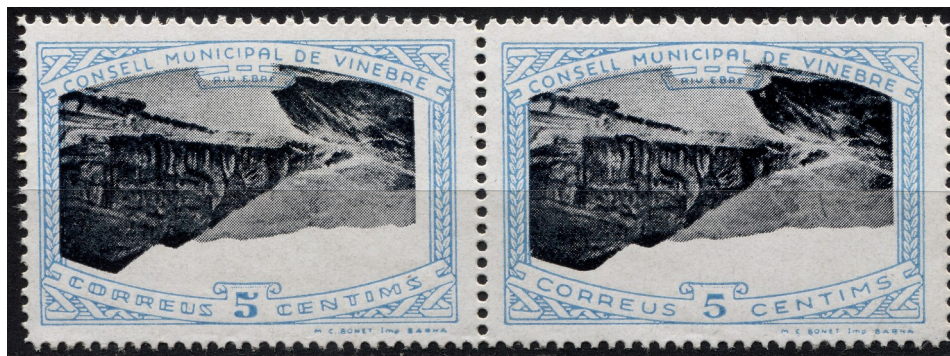
4 (Allepuz 9ba) Parella horitzontal