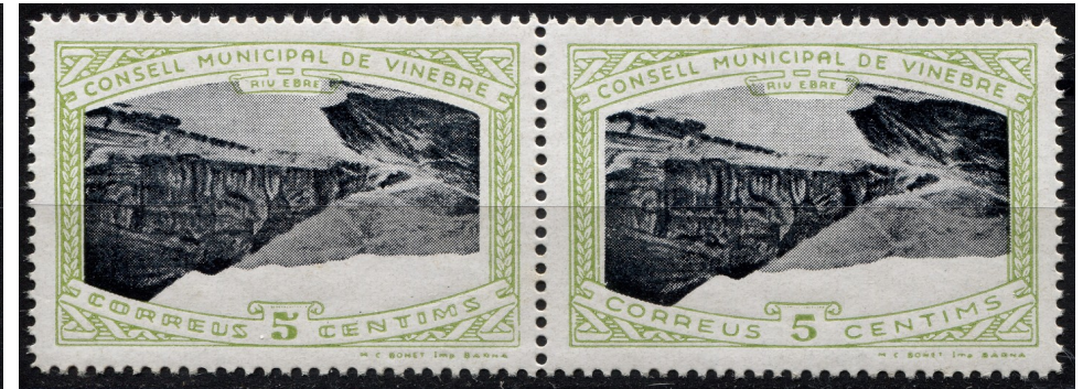
8 (Allepuz 10ba) Parella horitzontal