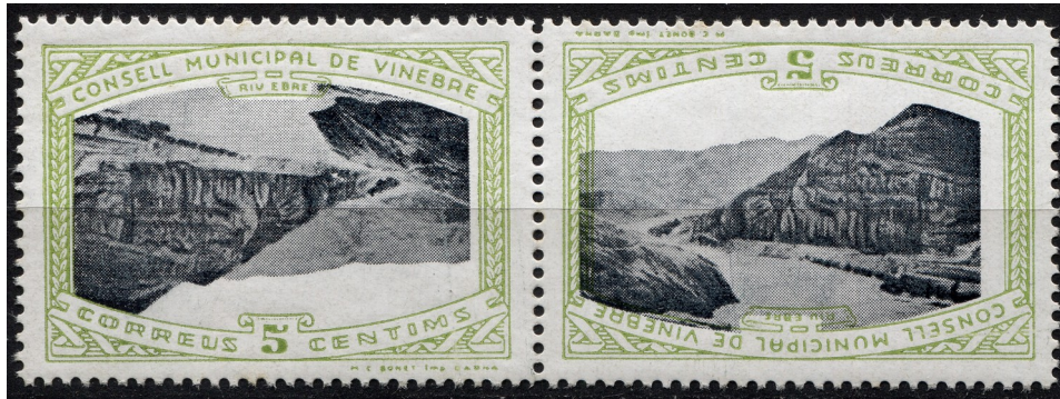
7 (Allepuz 2aii) Parella capicua