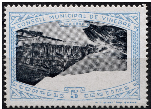
1 (Allepuz 1a) Caracters dobles