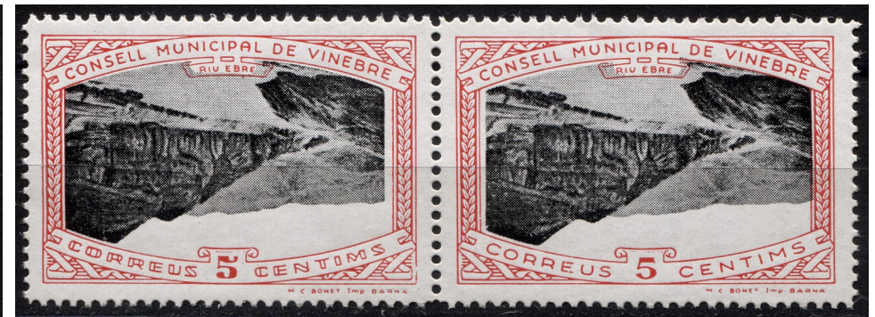
12 (Allepuz 11ba) Parella horitzontal