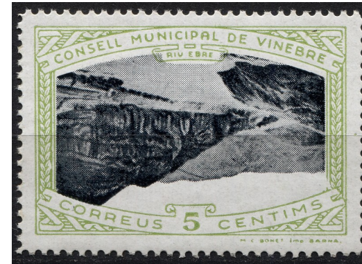
6 (Allepuz 10a) Caracters senzills