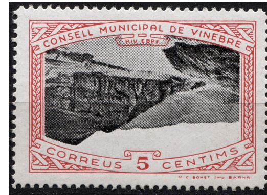
10 (Allepuz 11a) Caracters senzills