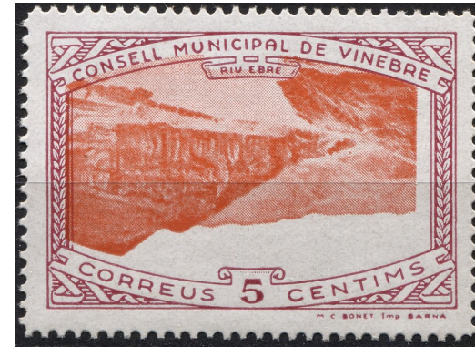
14 (Allepuz 12a) Caracters senzills