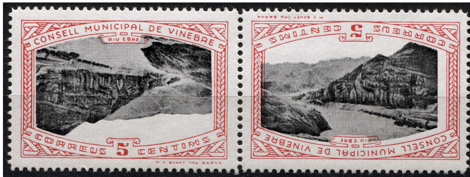
11 (Allepuz 3a ii) Parella capicua