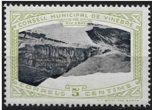
5 (Allepuz 2a) Caracters dobles