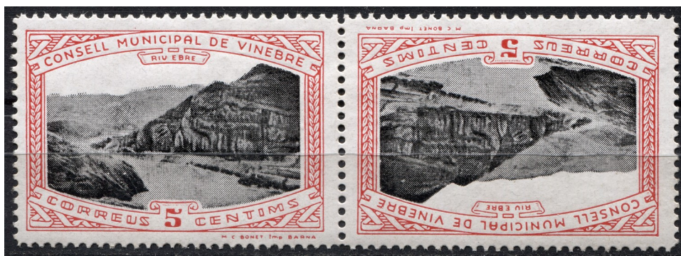
Emissió regular en parella capicua