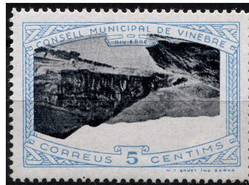
2 (Allepuz 9a) Caracters senzills