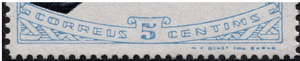
Exemple amb caracters dobles a la llegenda inferior

Les posicions 5, 10, 15, 20 i 25 presenten caracters simples a "CORREUS" i "CÈNTIMS" (S), mentre que la resta tenen caracters dobles en aquesta llegenda (D).